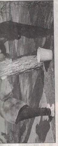
Побелка деревьев. - впереди