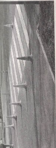
Обновленные пешеходные переходы.