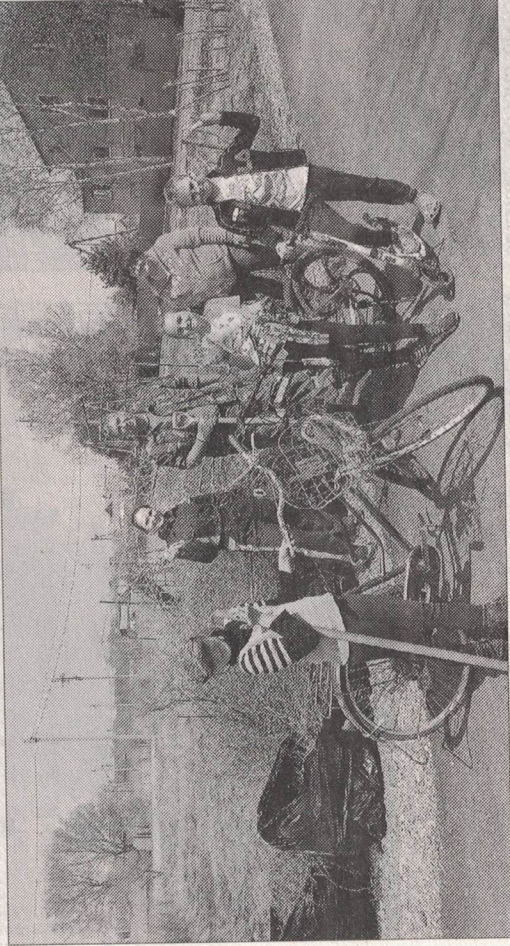
Михайловцы борются с мусором всей семьей.