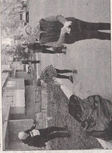
Новошахтинцы за чистоту.