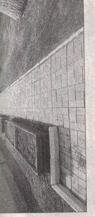
Чистый «Сосновый дворик».